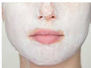
Bol d'Oxygène: Nettoyer