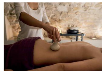
Cocooning Body & Face: Restaurer et Relaxer

Offre valable jusqu'au printemps 2017, Réservations sur www.lachrysalide.ch , onglet "Prendre rdv" puis "Rubrique Forfait", 4 soins pour sortir de l'hiver.