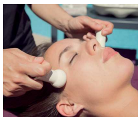
Face Cocooning: Hydrater

Cette plante aux propriétés fascinantes vous transportera vers le bien-être par un voyage sensuel de senteurs alpines, d'eau des glaciers, de massages revisités... Réservez sans plus attendre!